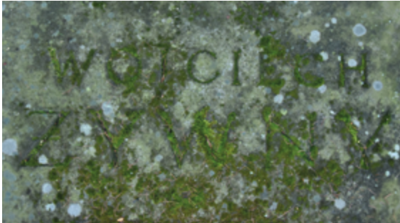
← Grób Wojciecha Żywnego, nauczyciela Fryderyka Chopina.