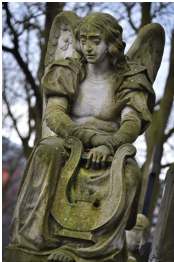
↑ Fragment grobu Józefa Elsnera.